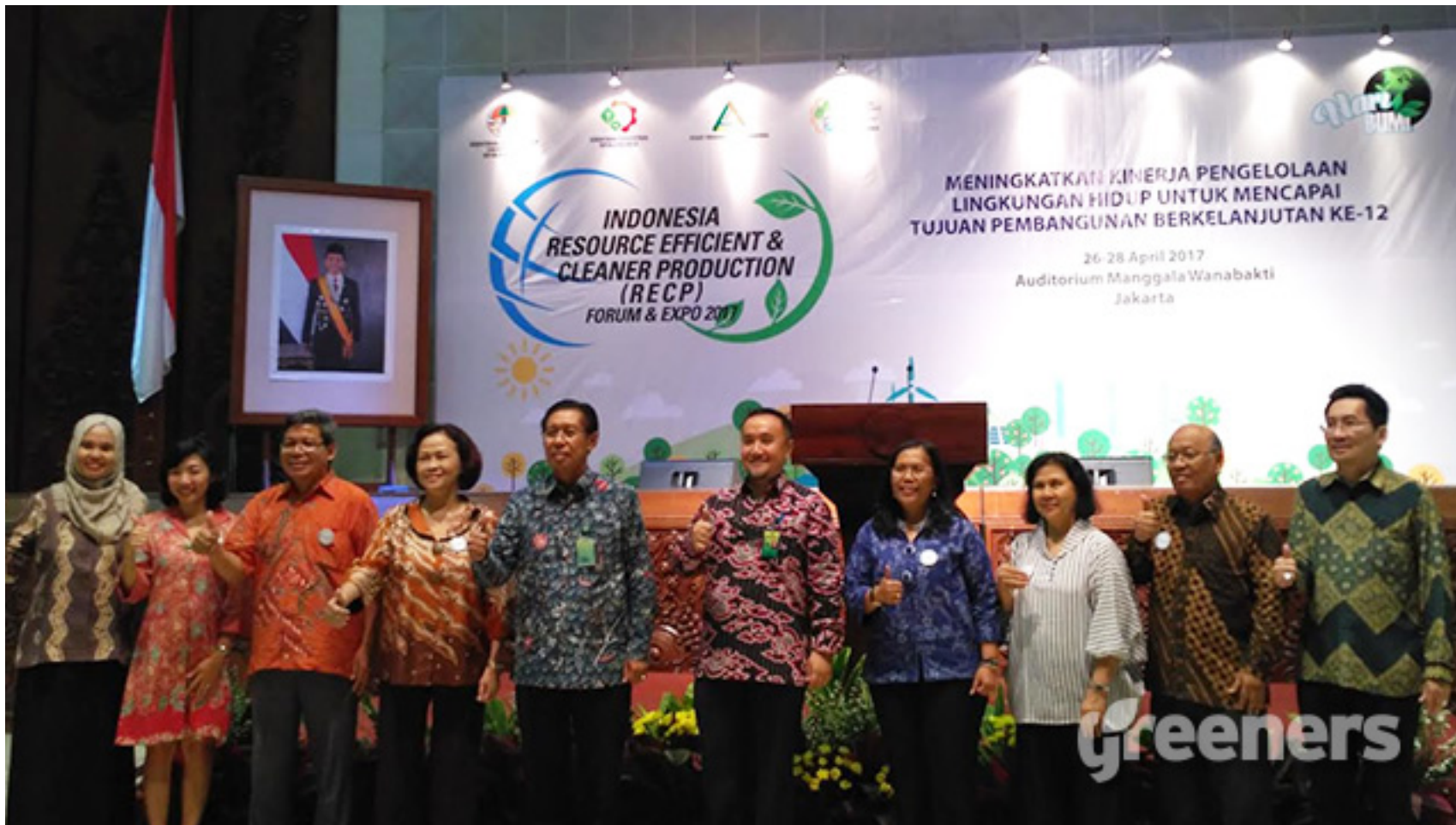
Staf Ahli Menteri Lingkungan Hidup dan Kehutanan Bidang Hubungan Antar Lembaga

Home » Aksi » Indonesia RECP Forum & Expo 2017 Ajak Pelaku Industri Realisasikan SDG s